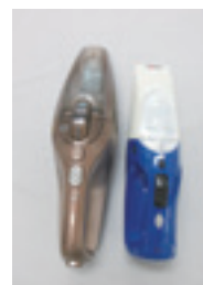
ハンディクリーナー

このような製品にも充電式電池が内蔵されています。 プラスチックで出さないでください!